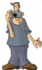
FOTO AF TÆNDER OG ANSIGT.

Vi skal bruge nogle helt almindelige fotos af dit ansigt og af dine tænder. Der er tale om ca. 5 billeder af ansigtet. Derudover skal vi bruge ca. 5 fotos af tænderne. For at få tilstrækkeligt lys på tænderne, bruger vi små holdere til læben og nogle spejle inde i munden. Det er vigtigt man sidder helt stille når der fotograferes.